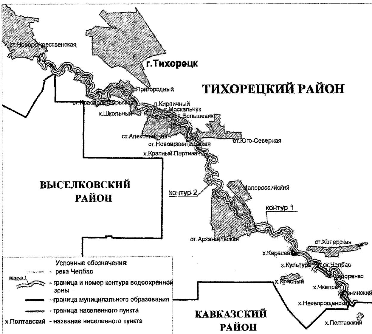
Схема границ контуров водоохранных зон реки Челбас на участке х. Полтавский Кавказского района – ст-ца Новорождественская Тихорецкого района Краснодарского края

УТВЕРЖДЕНА приказом министерства природных ресурсов Краснодарского края от 28.10.2015 № 1727