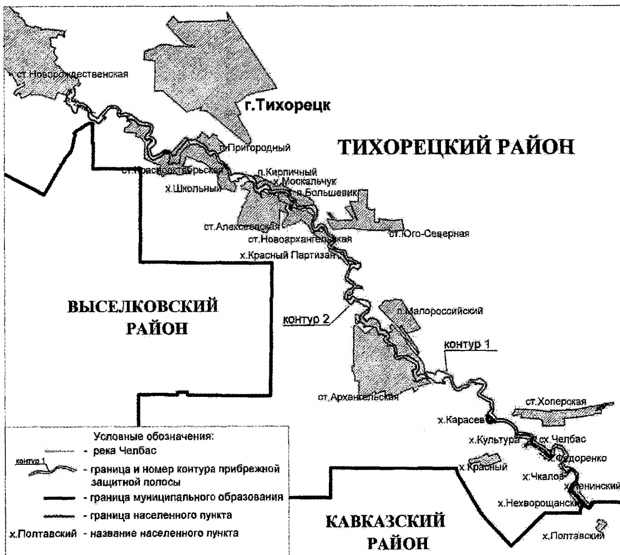
Схема границ контуров водоохранных зон реки Челбас на участке х. Полтавский Кавказского района – ст-ца Новорождественская Тихорецкого района Краснодарского края

приказом министерства природных ресурсов Краснодарского края от 28.10.2015 № 1727