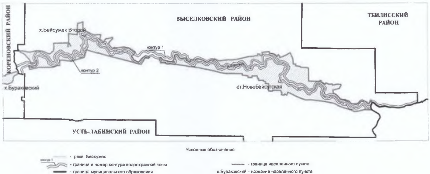
Схема границ контуров водоохранных зон реки Бейсужек на участке ст-ца Новобейсугская Выселковского района - х. Бураковский Кореновского района Краснодарского края

Общая площадь территории в границах контуров водоохранных зон реки Бейсужек на участке ст-ца Новобейсугская Выселковского района - х. Бураковский Кореновского района Краснодарского края составляет 1516,47 га, в том числе: